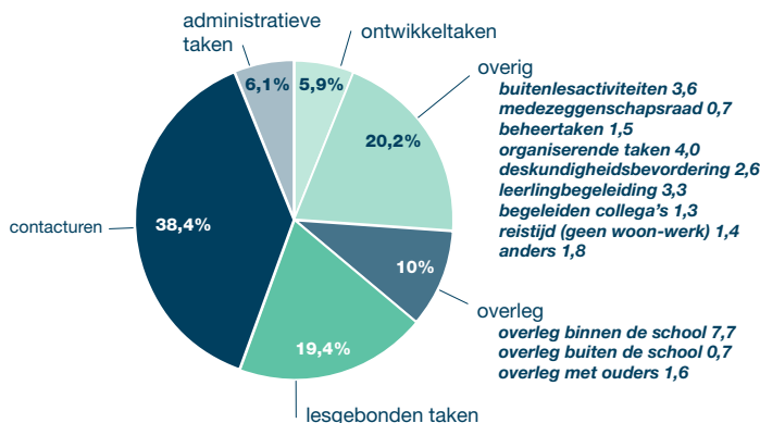
Percentage van de gewerkte tijd (%) per werkweek

Bron: Tijdsbesteding leraren VO, 2008, Regioplan Beleidsonderzoek nr. 1630